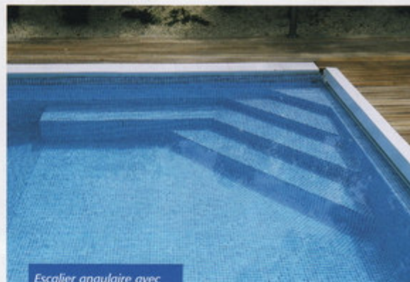
Escalier angulaire avec banquette intégrée. Membrane mosaïque (Réalisation Eden Pool / réseau Piscines de France - 40).

Évitez tout contact direct de la membrane armée avec les produits ou matières suivantes :