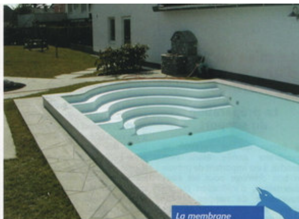
La membrane armée autorise la conception de tout type d'escalier (document DLW dellifol).