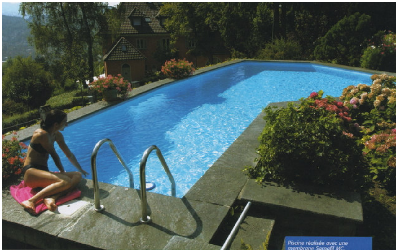
Piscine réalisée avec une membrane Sarnafil MC. Membrane à base de polyolfines souples (FPO) et non de PVC, fabriquée par enduction (document Sarnafil).

Très souvent, la membrane armée est fixée en haut de parois dans un profilé d'accrochage situé sous les margelles, comme c'est le cas pour un liner. Pour cela, on applique au préalable une bandelette de PVC sur le bord des lés, de façon à permettre leur accrochage dans le profilé fixé en tête de paroi.