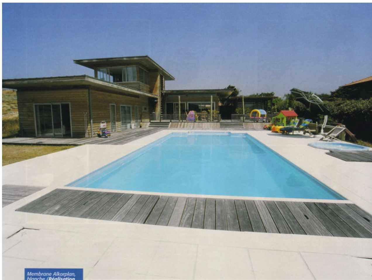
Membrane Alkorplan, blanche (Réalisation Aquatic Piscine - 40).