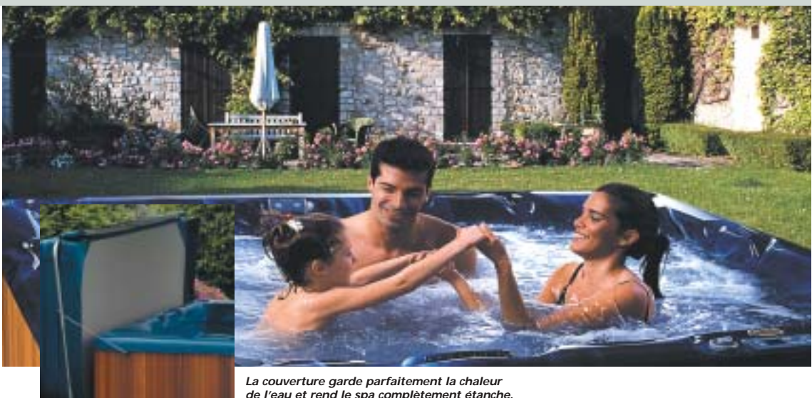
La couverture garde parfaitement la chaleur de l'eau et rend le spa complètement étanche.

La couverture peut être comparée au couvercle d'un thermos. Elle garde parfaitement la chaleur de l'eau et rend le spa complètement étanche. Elle permet d'énormes économies d'énergie, en plus du système Protec. Standard elle est déjà très épaisse : 7,5 cm. Renforcée elle fait 10 cm d'épaisseur. Toutes sont équipées d'un verrou ce qui garantit la sécurité d'accès à votre spa.